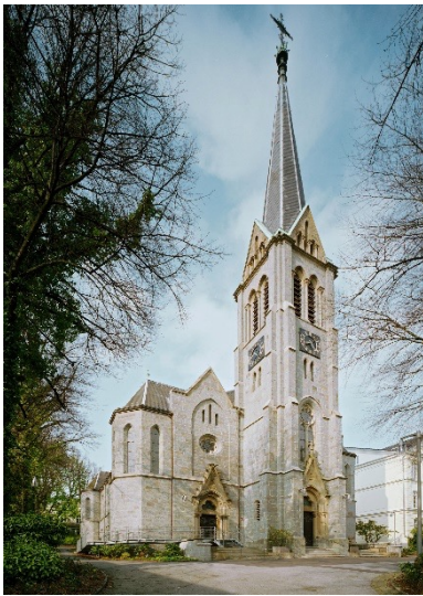
Deimel und Wittmar