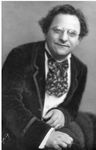
Karg-Elert-Gesellschaft e. V.

18.00 Uhr | Eröffnungskonzert mit Studierenden der Flötenklasse Prof. Dirk Peppel Ort: Konzertsaal der Musikhochschule (Sedanstraße 15, Wuppertal-Barmen)